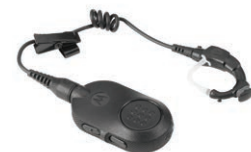
关键业务无线耳机

“当我看到摩托罗拉 SL 系列的第一眼，我以为它是一部手机，而不是真的双向对讲机。它拥有双向对讲机的一切功能，但外形却如此专业、隐秘，可谓与我们的制服浑然天成的绝配。”