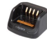
(锂/镍氢)电池MCU 通用快速充电座 CH10A07