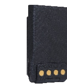
锂离子电池 (2000mAh) BL2010